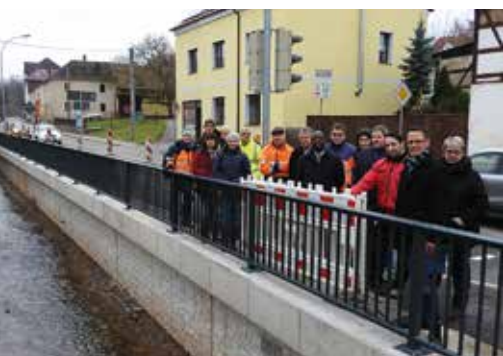
2017 erfolgte in Leubnitz die Freigabe der sanierten Stützmauern an der Einmündung Schulstraße