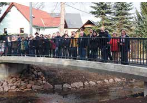
Freigabe der Pfarrbachbrücke Langenhessen im Jahr 2015