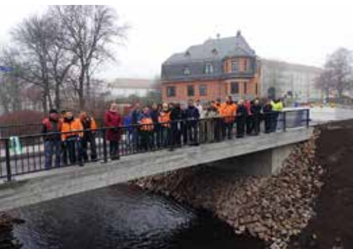
Die neue Brücke an der Gabelsbergerstraße wurde 2016 fertiggestellt