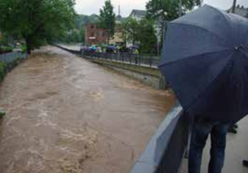
Das Hochwasser 2013 im Bereich Turnhallenstraße/Sternplatz